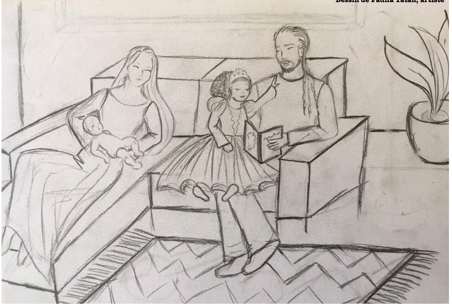
Dessin de Fadila Tatab, artiste